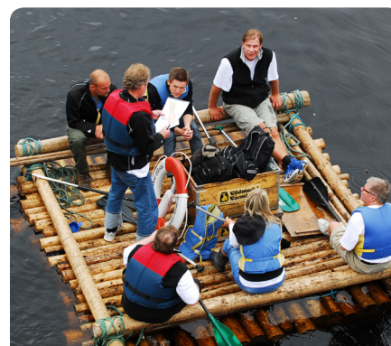
Tid för möten och samtal