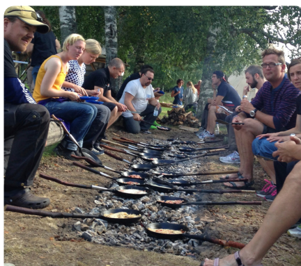
Ät ute på riktigt