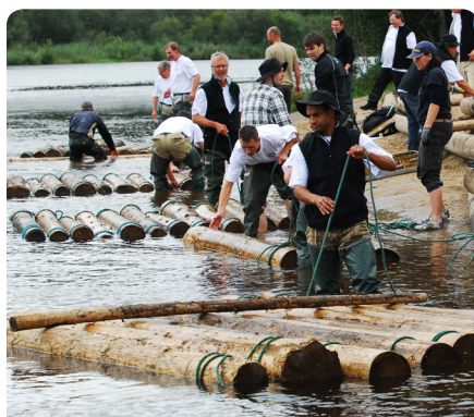
Äkta lagarbete där alla deltar

Hos oss kan konferenslokalen vara en timrad flottarkoja med samtal och diskussioner runt den öppna elden. Det kan också vara grupparbeten ombord på en timmerflotte som sakta glider fram på Klarälven eller i en kåta vid älvens strand. Vårt signum är att skapa de rätta förutsättningarna med aktiviteter, mat och boende så konferensen blir en värdefull investering som genererar utveckling och förnyelse i företaget.